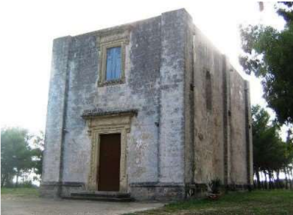
Chiesetta di San Giuseppe, (metà 1600) Salignano