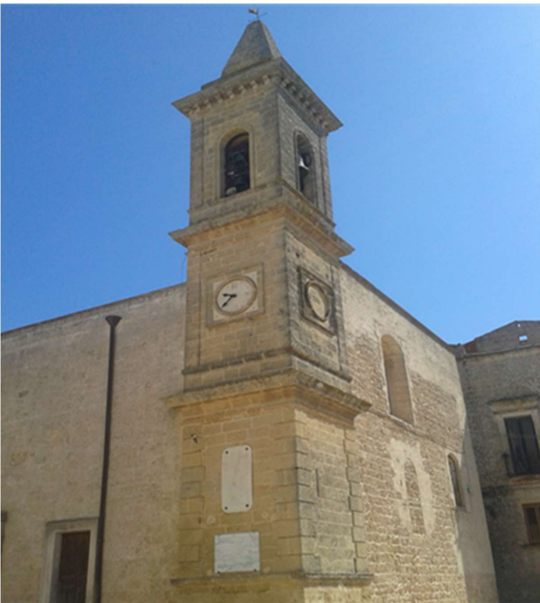
Campanile San Giovanni