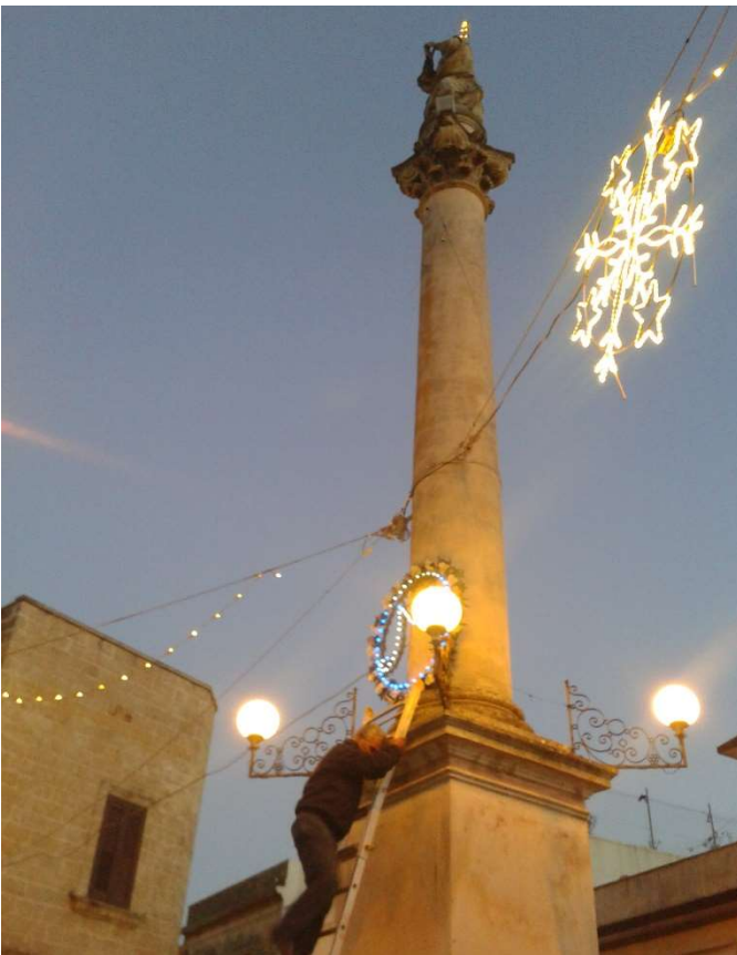
Rito della corona di fiori