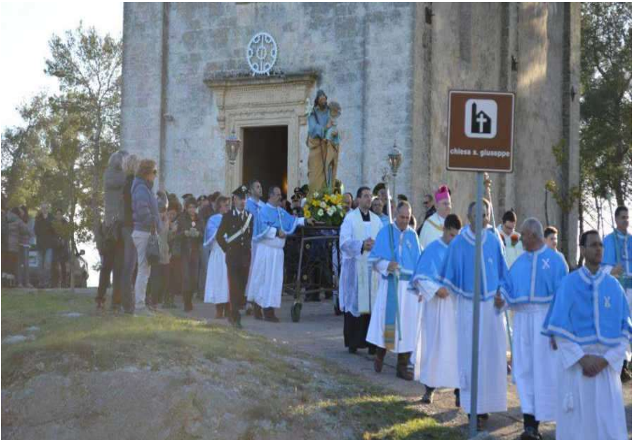
Processione di San Giuseppe, Salignano