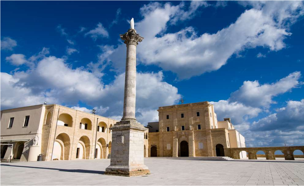
Santuario di Santa Maria di Leuca(metà 1700)