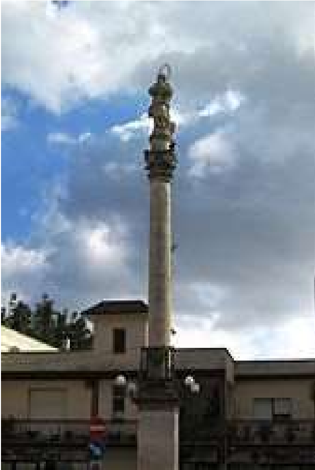
Colonna dell'Immacolata, (1838) Castrignano