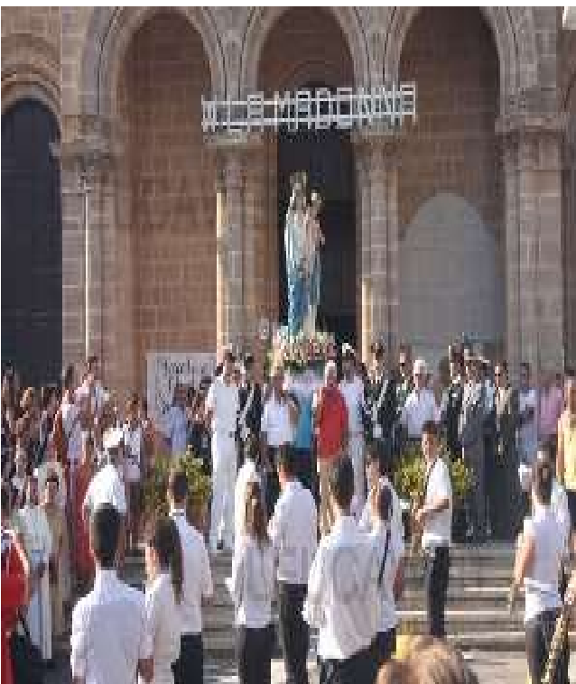
Processione del 15 Agosto, Leuca