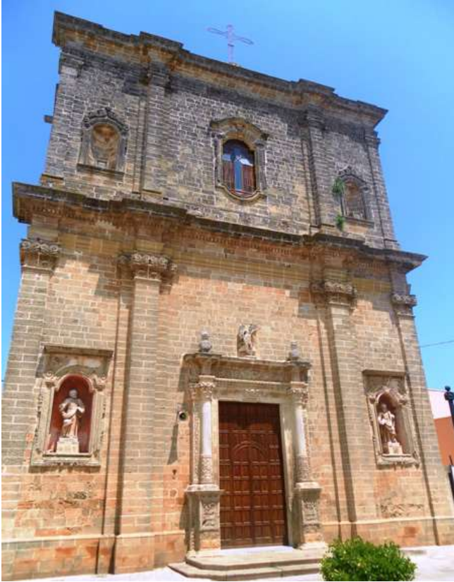
Chiesa di San Michele Arcangelo (metà 1700), Castrignano del Capo.