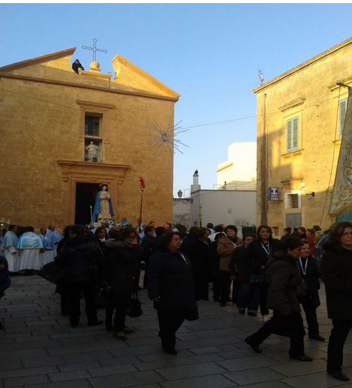
Processione dell'Immacolata, Chiesa di Santa Maria (metà 1600) Castrignano del Capo