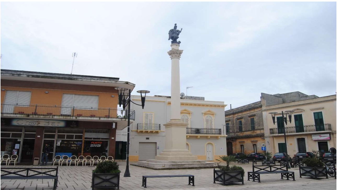
Colonna di San Michele Arcangelo, (1839) Castrignano