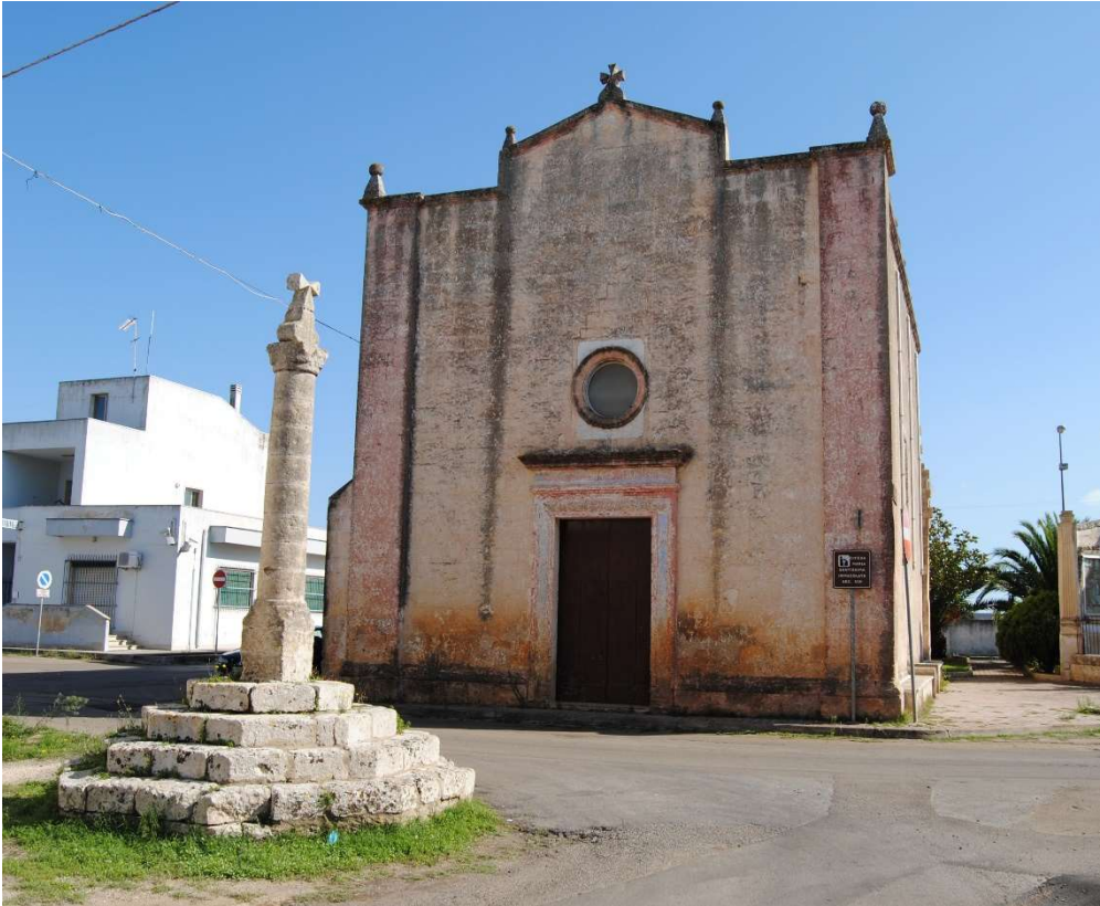
Chiesetta Madonna del Canneto, (metà 1600) Giuliano