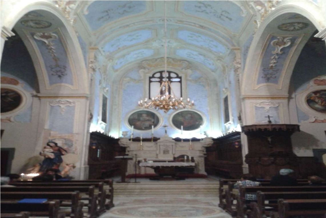
Interno Chiesa di San Giovanni Crisostomo, Giuliano