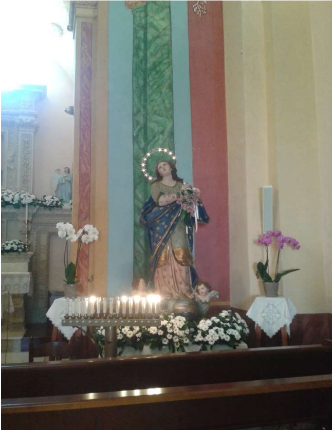
Statua dell'Immacolata, Giuliano