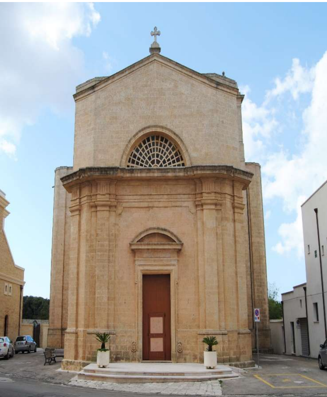
Chiesa di Sant'Andrea (metà 1700) Salignano.