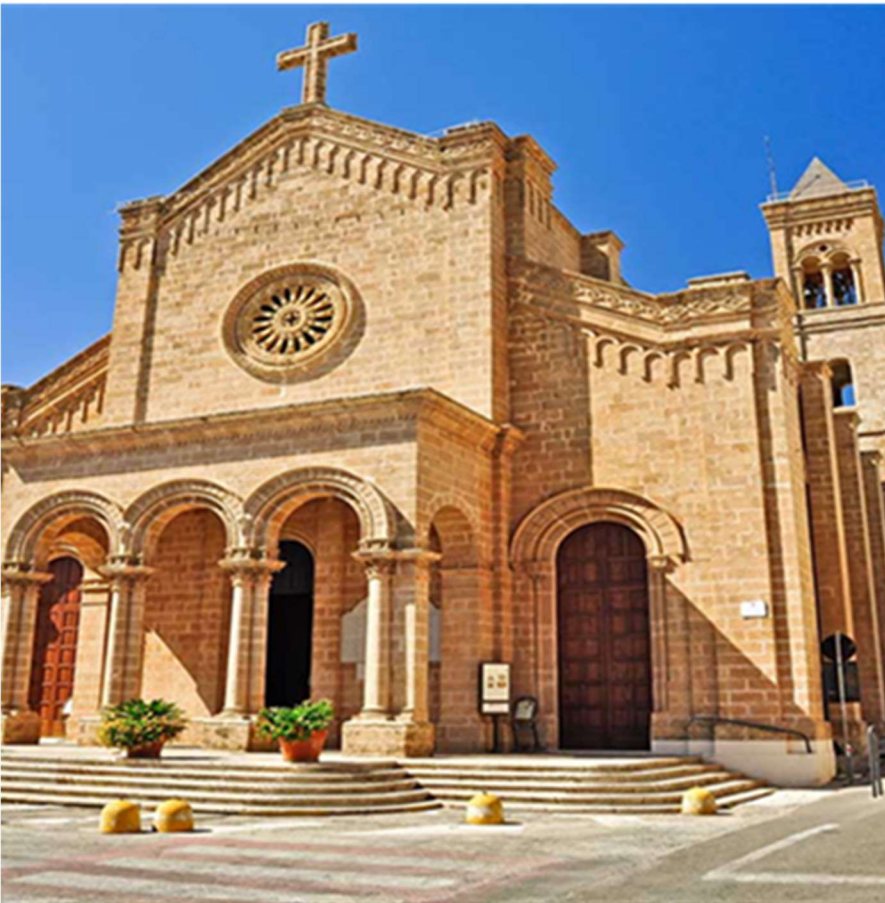
Chiesa di Cristo Re,(1935) Leuca