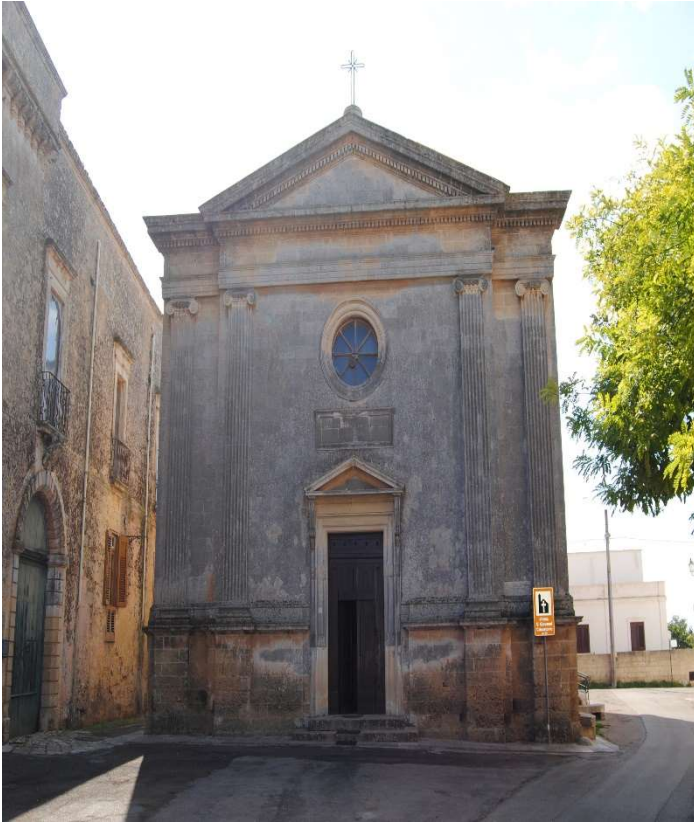
Chiesa di San Giovanni Crisostomo (metà del 1600)