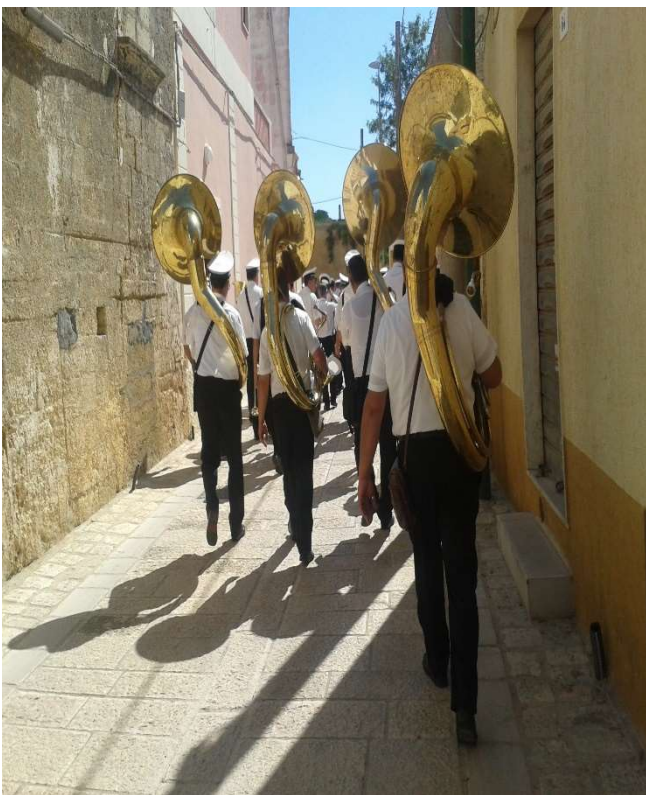
Corteo del Rito della Bandiera