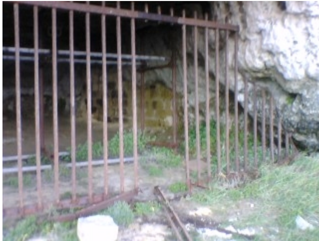
GROTTA PORCINARA - LEUCA