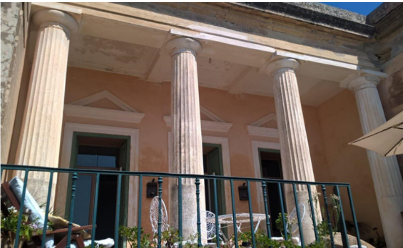
Villa Gioacchino Fuortes