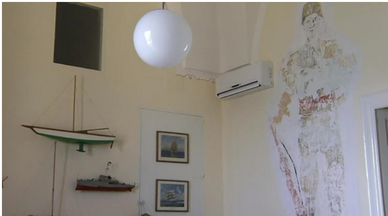
Affresco di un soldato delle Jewish Brigade ritrovato in una villa a Tricase Porto

Locandina di proiezione di Shores of Light nella cineteca di Gerusalemme nel mese di Ottobre 2018.